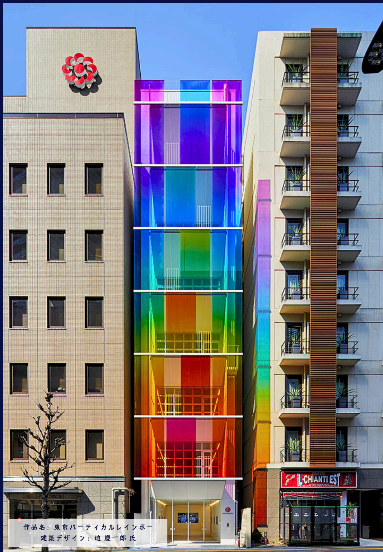
作品名：東京パーティカルレインボー 建築デザイン：迫慶一郎氏

This is a notice from Musashi Paint Co., Ltd.